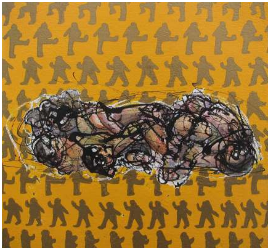
Guillermo Bermudo Inocentes Mixta sobre tabla, 20x20 cm