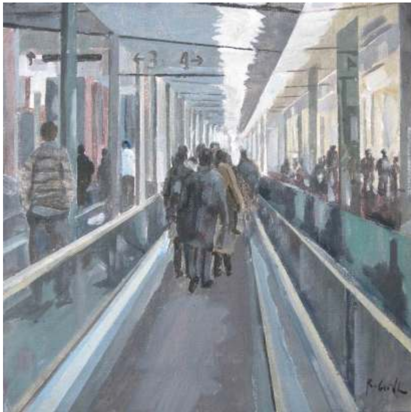
Rafael Cerdá Zona de tránsito Acrílico / tela 33x33cm