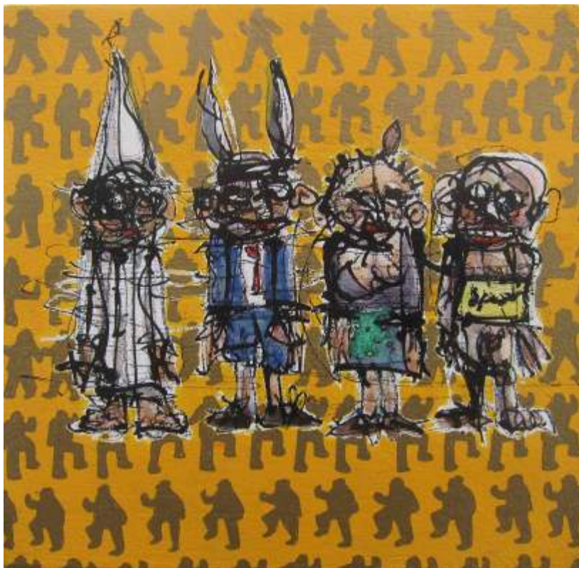
Guillermo Bermudo Castigados Mixta sobre tabla, 20x20 cm