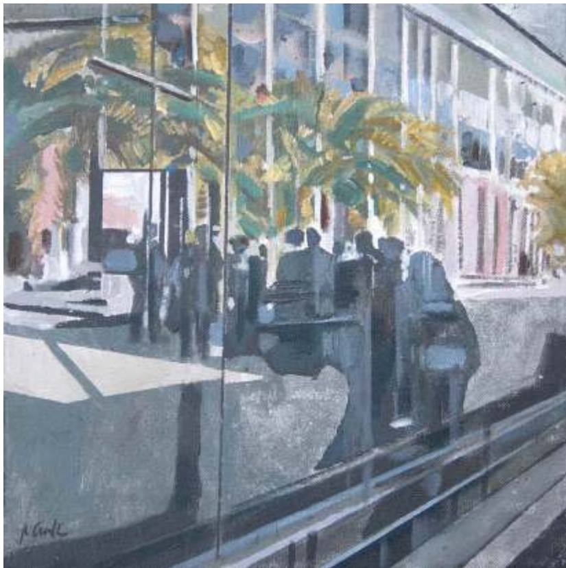
Rafael Cerdá Espacio urbano Acrílico / tela 33x33cm