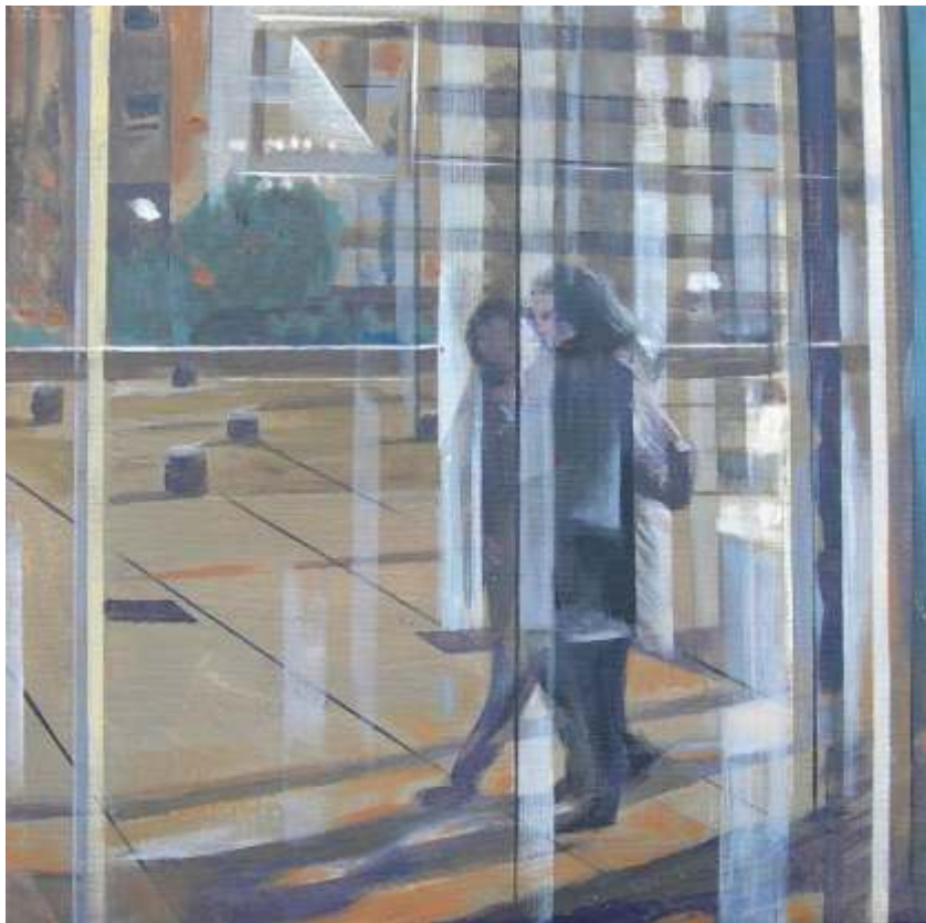
Rafael Cerdá Espacio urbano III Acrílico / tela 33x33cm