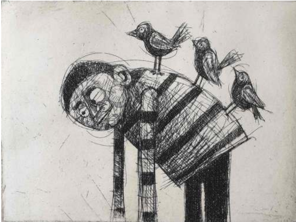
Guillermo Bermudo El peso de los maestros Aguafuerte, 30x20 cm (matriz: 14x11 cm)