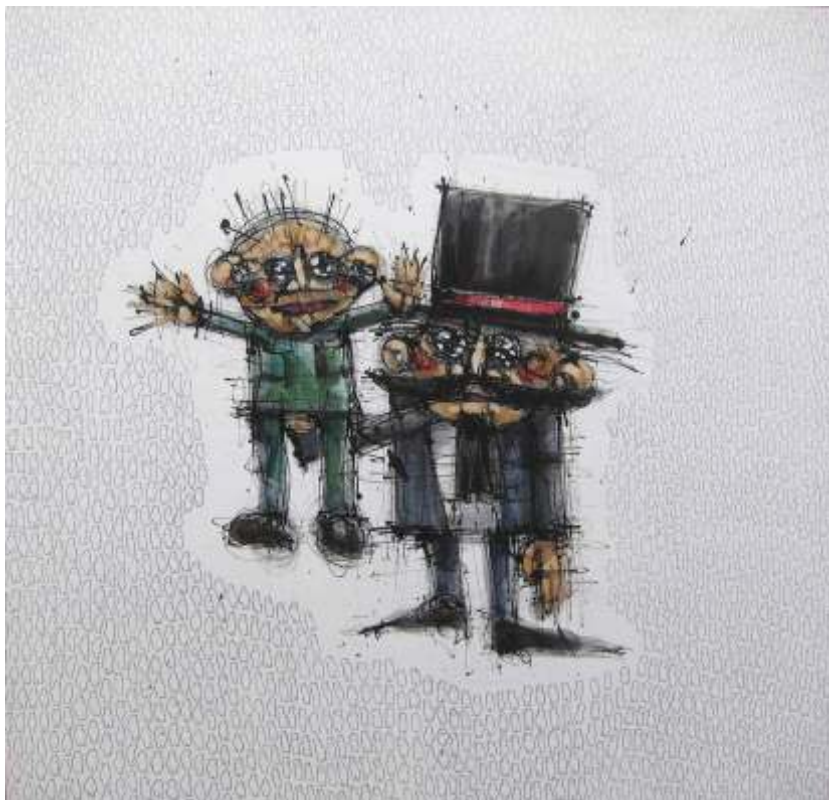
Guillermo Bermudo Ventrifloco I Mixta sobre tabla, 80x80 cm