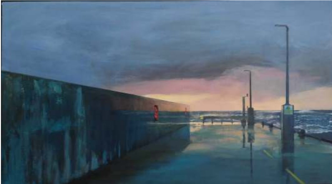
Santiago Castillo Irlanda Mixta sobre tabla, 83x148 cm