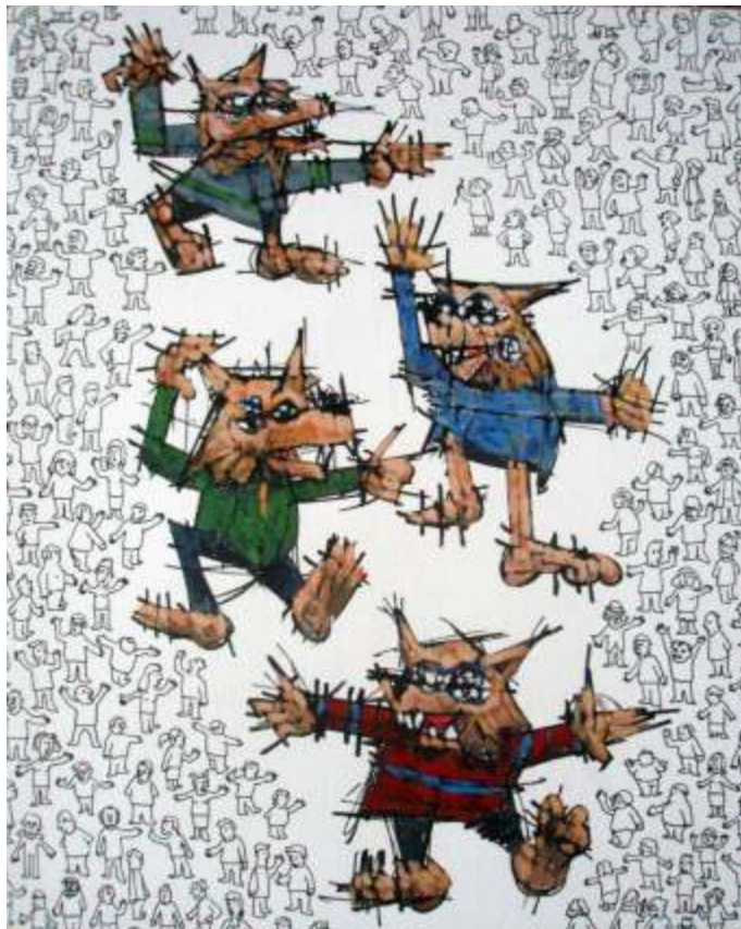
Guillermo Bermudo El baile de los antropocanes Mixta sobre tabla, 40x30 cm