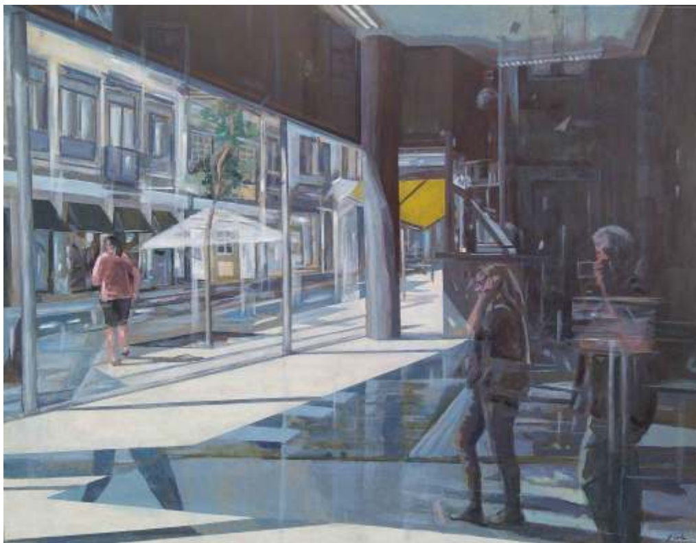
Rafael Cerdá Reflejos (Oporto) Acrílico sobre tela, 114x146 cm