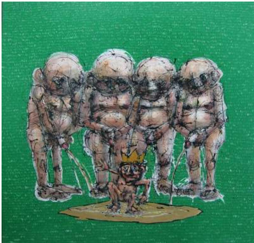
Guillermo Bermudo Orines reales Mixta sobre tabla, 100x100 cm