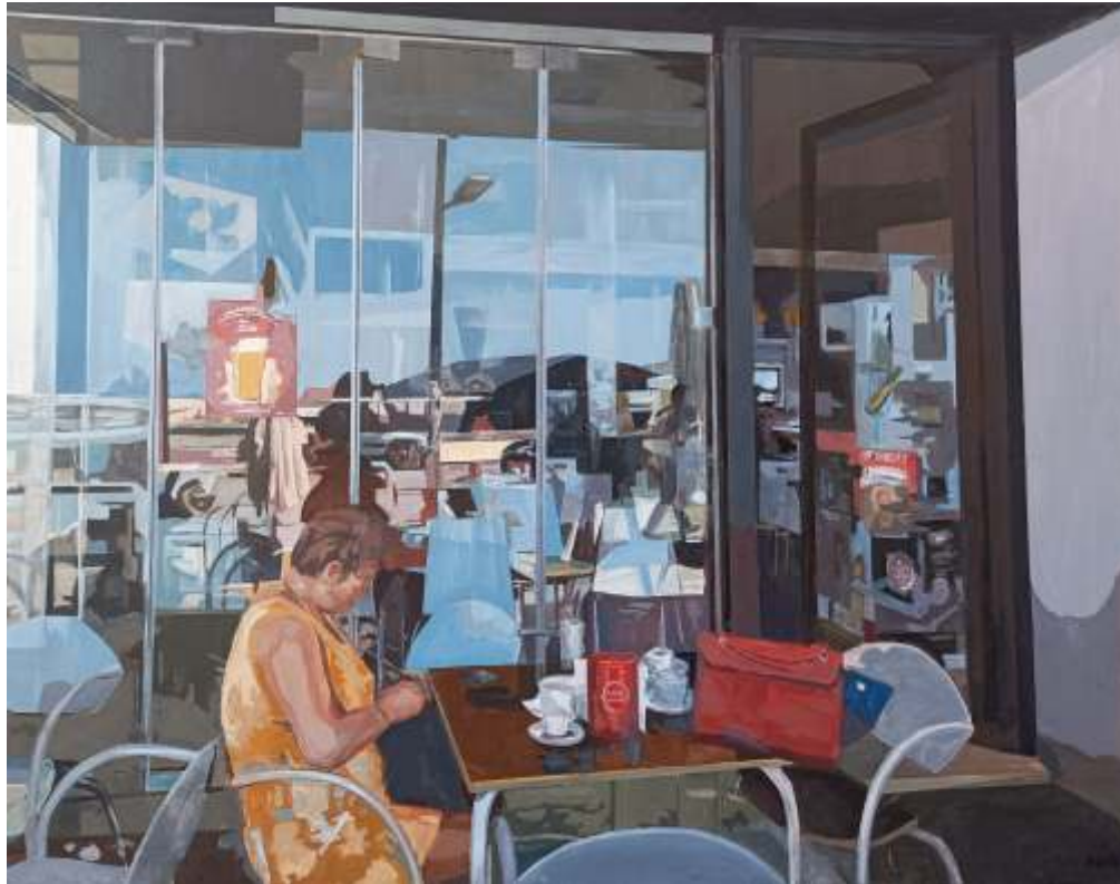
Rafael Cerdá Reflejos X Acrílico sobre tela, 114x146 cm