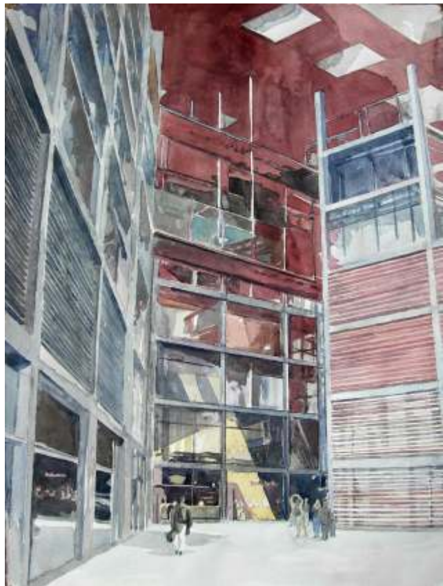
Rafael Cerdá Reina Sofía (Nouvel) Acuarela/papel 76x55cm