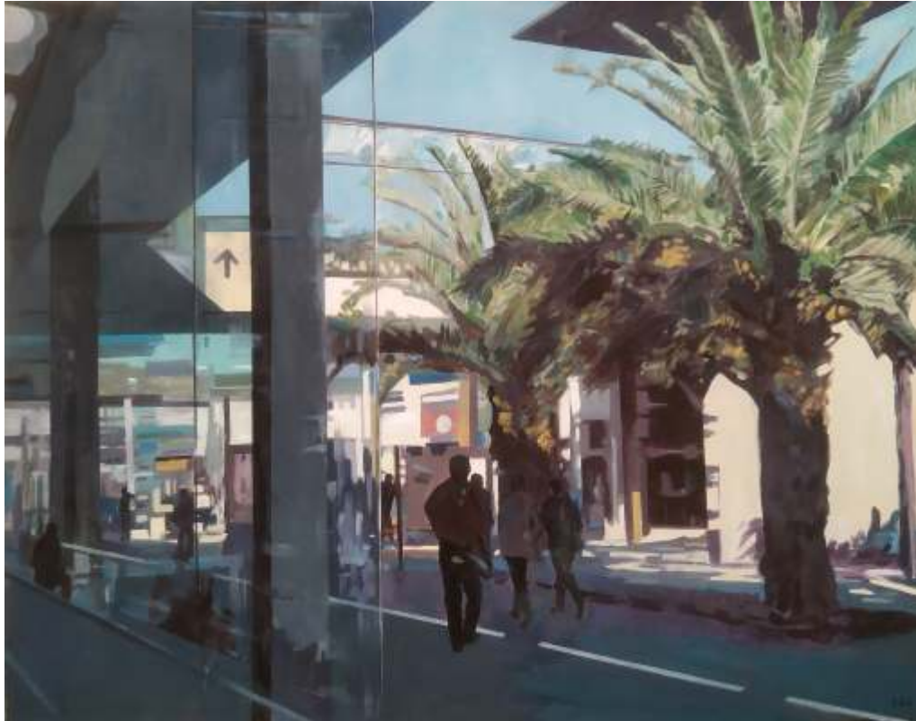
Rafael Cerdá Espacio urbano Acrílico sobre tela, 114x146 cm