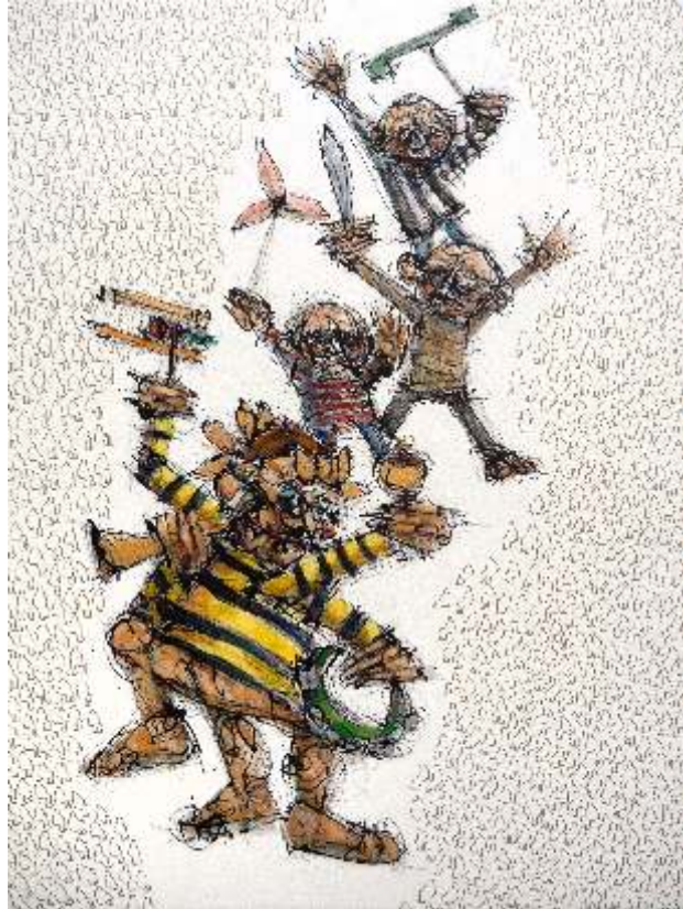
Guillermo Bermudo Hamelin Mixta sobre tabla, 60x40 cm