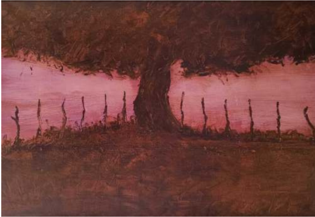
Santiago Castillo Quercus Acrílico sobre tela. 97x146 cm