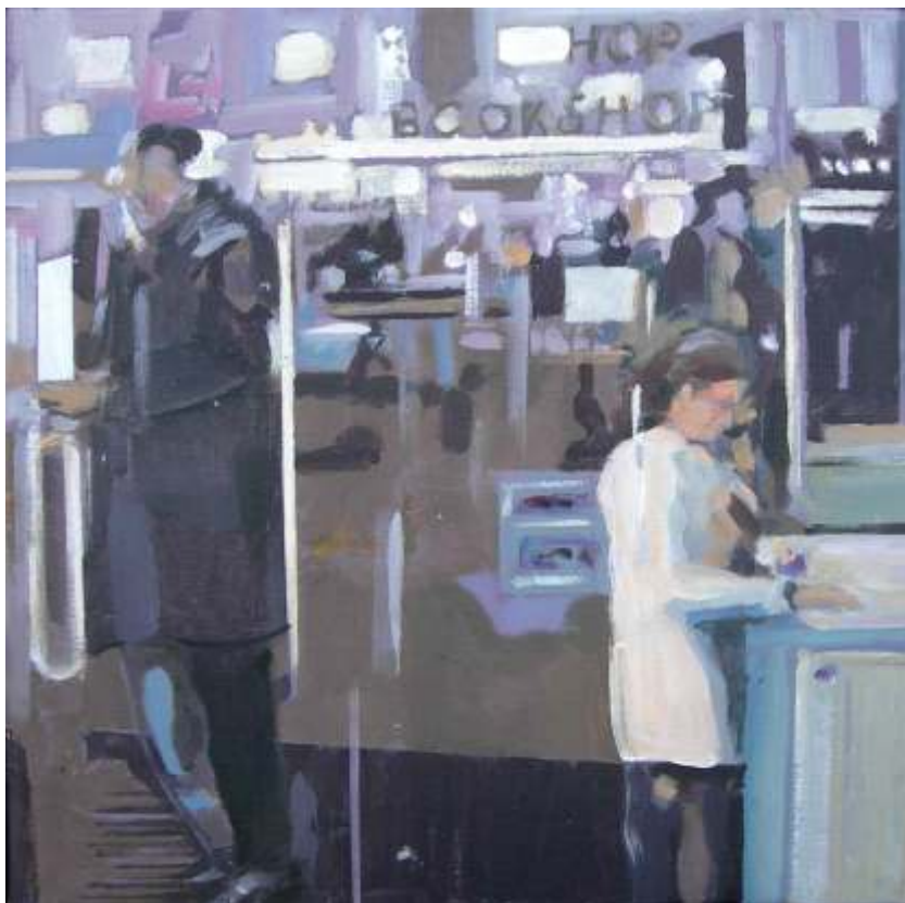
Rafael Cerdá Librería Acrílico / tela 33x33cm