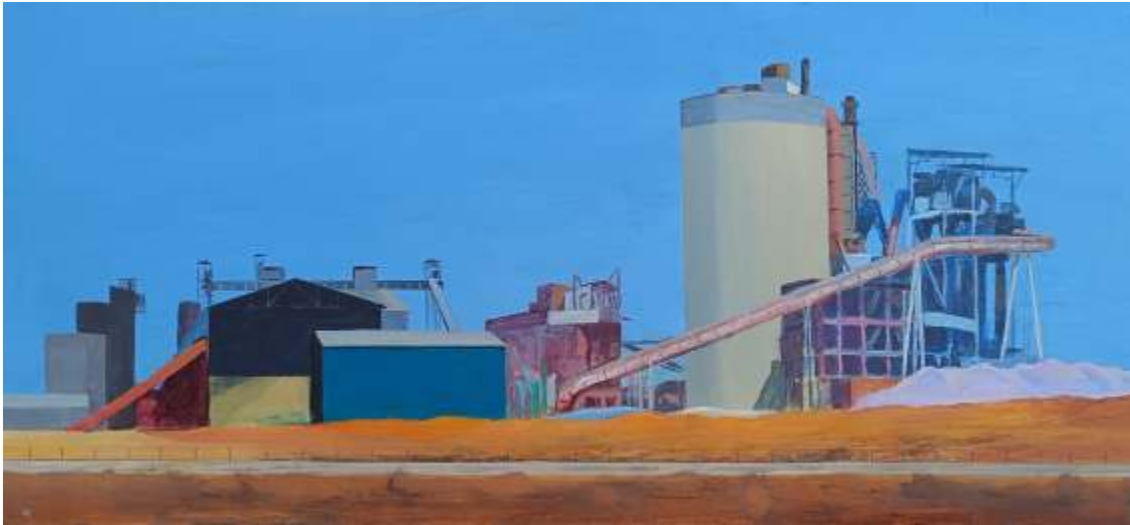
Santiago Castillo Cementera Acrílico sobre tabla. 40x121 cm